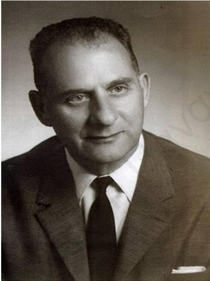
Λουκίας Ακρίτας (1908-1965)