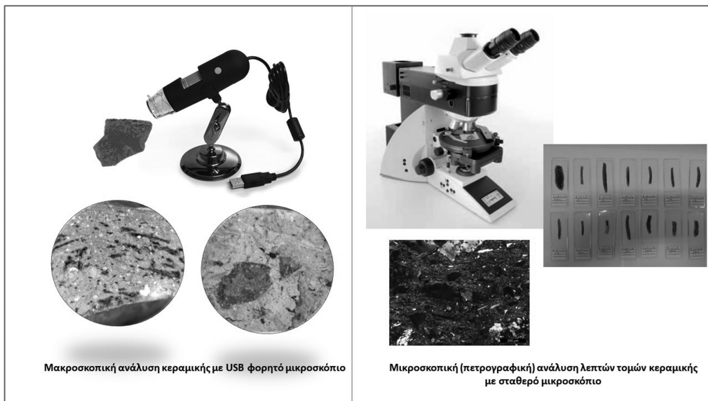
Εικόνα 2. Μεθοδολογική προσέγγιση στη μελέτη και ανάλυση κεραμικής από την προϊστορική Σάμο.

και επιφανειακών ευρημάτων λίθινων εργαλείων που χρονολογούνται στην 2 η χιλιετία π.Χ. (Μέση και Ύστερη Εποχή του Χαλκού), στη νοτιοανατολική Σάμο περιλαμβάνουν έναν θαλαμωτό τάφο της Ύστερης Μυκηναϊκής περιόδου στο χωριό Μύλοι και σποραδικά ευρήματα στον Κάβο Φονιά (Κάβο Τζωρτζής) και στον Μεσόκαμπο 7 .